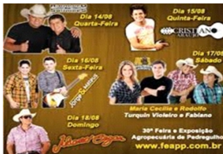
Cartaz com a programação da 30ª FEAPP