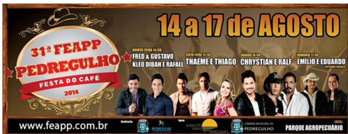
Cartaz ilustrativo com a programação 31ª FEAPP