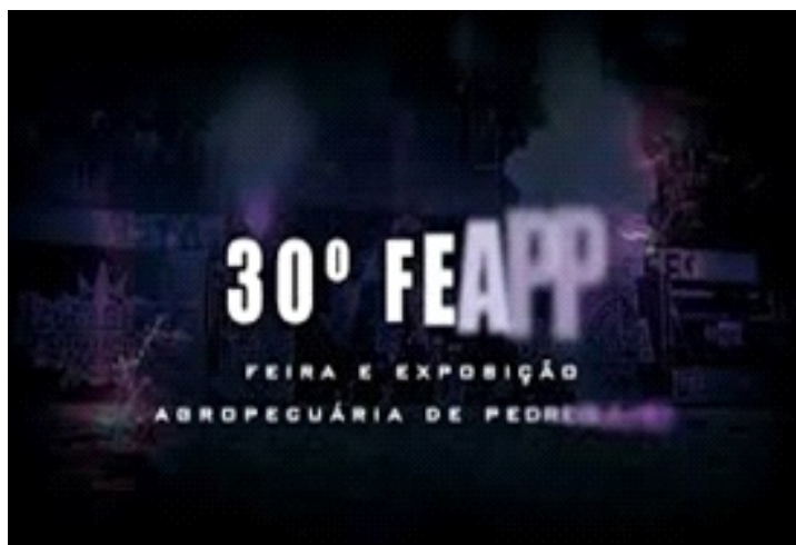
Foto do Vídeo de abertura da 30ª FEAPP