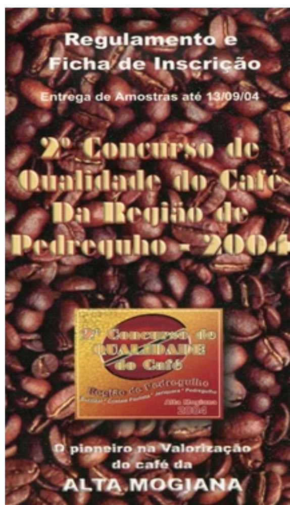
Fôlder do 2º Concurso do Café