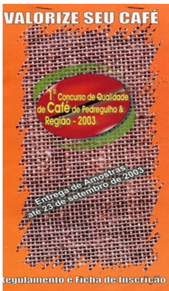
Fôlder do 1º Concurso do Café