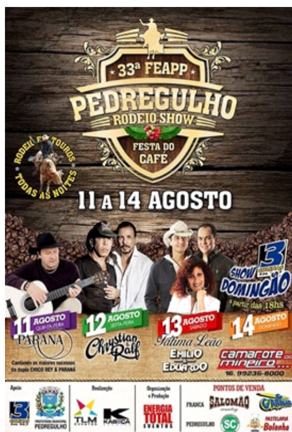
Cartazes ilustrativos com as programações da 32ª e 33ª FEAPP